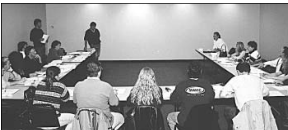
Le même groupe attentif...

La situation au Lac St-Jean est probablement différente des grandes villes puisqu'il y a plusieurs divisions qui ne