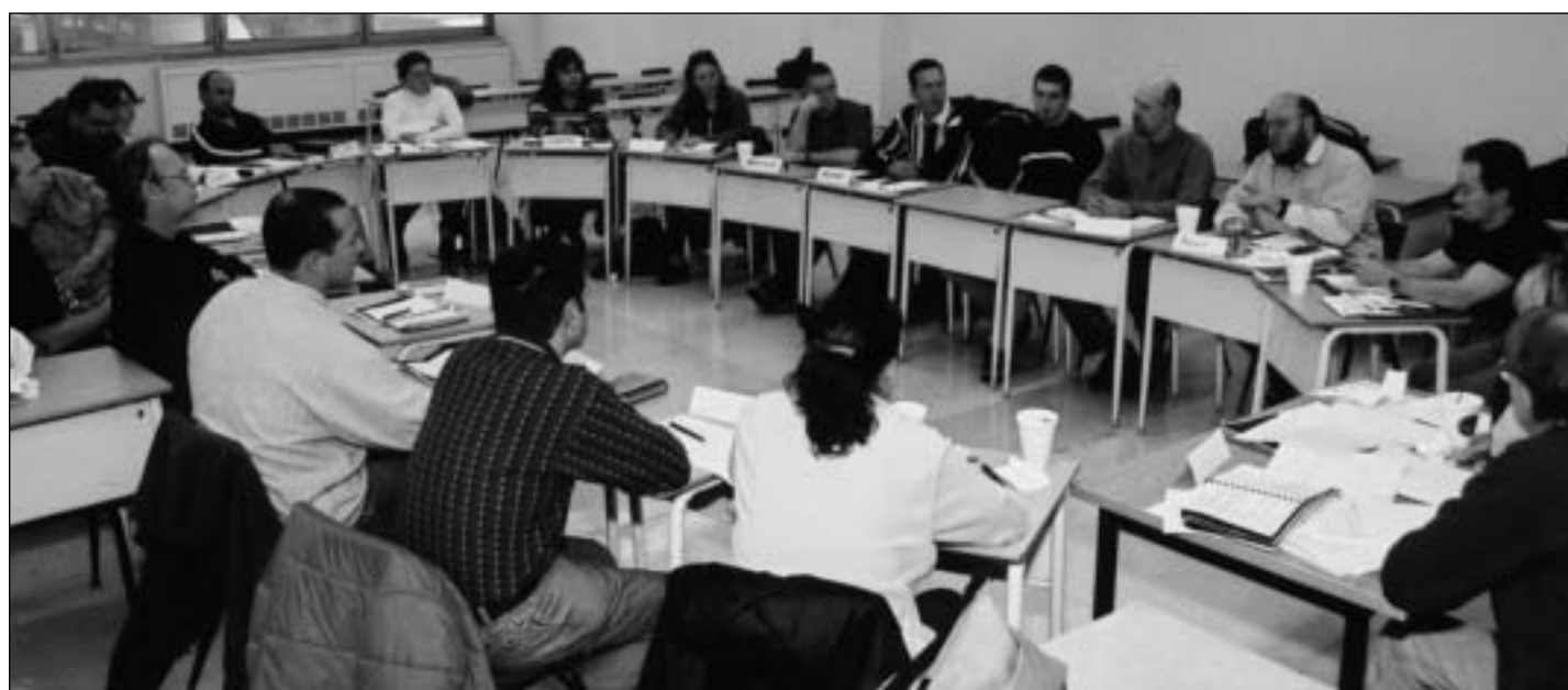
Table de concertation sur les assurances, octobre 2002.

L'automne 2002 et l'hiver 2003 représentent des moments cruciaux pour le SEMB-SAQ. En effet, malgré le retard occasionné par la période de maraudage et certaines autres situations conflictuelles non souhaitées par votre Exécutif, les travaux préparatoires au renouvellement de la convention collective se déroulent en ce moment. C'est donc à pleine vapeur que la machine syndicale et ses représentants avancent pour rattraper le temps perdu.